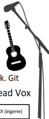
Ak. Git Lead Vox