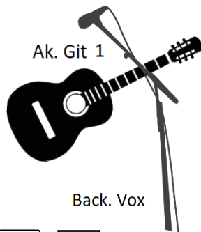
Ak. Git 1